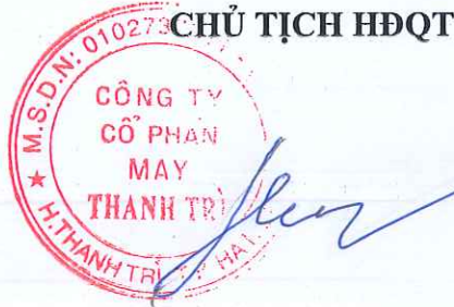
Trần Trọng Phúc

Cuộc họp kết thúc và được lập Biên bản vào hồi 10h30 cùng ngày. Biên bản cuộc họp được thông qua với sự tán thành của 5/5 thành viên Hội đồng quản trị và được lập thành 03 (ba) bản gửi các cơ quan hữu quan và lưu trữ tại Công ty./.