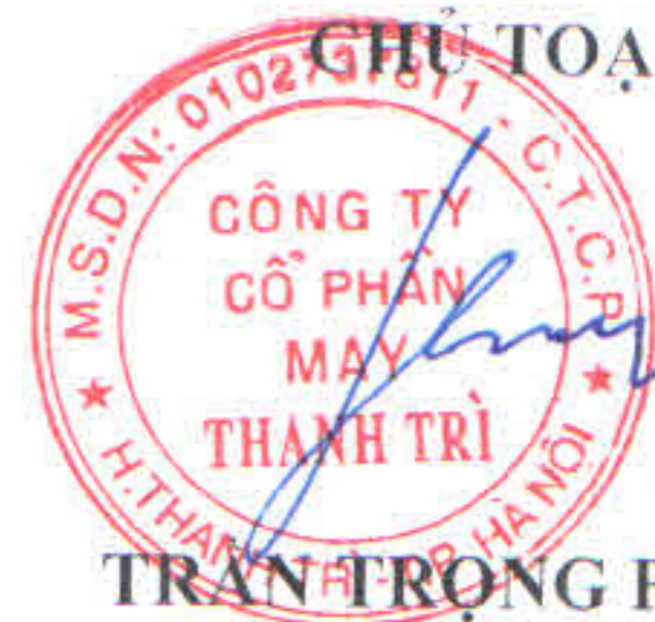
TRẦN TRỌNG PHÚC